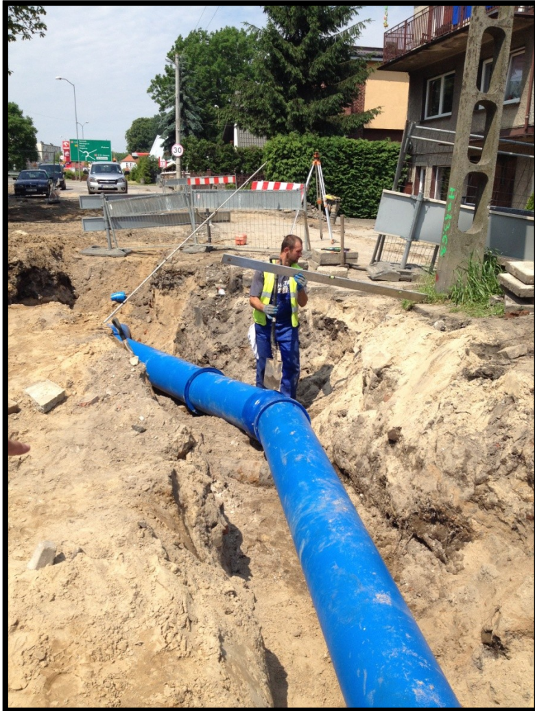
Goleniów, ul. Szkolna